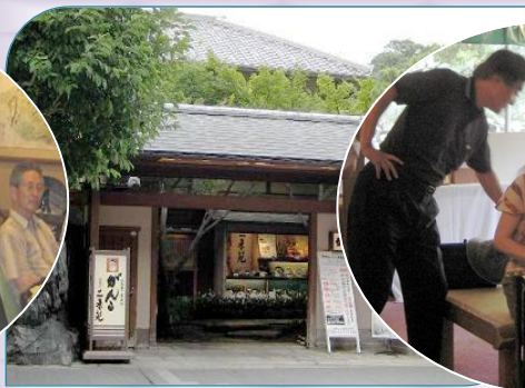
▲がんこ高瀬川二条苑の門