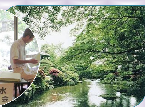
▲高瀬川源流庭園(がんこの庭)