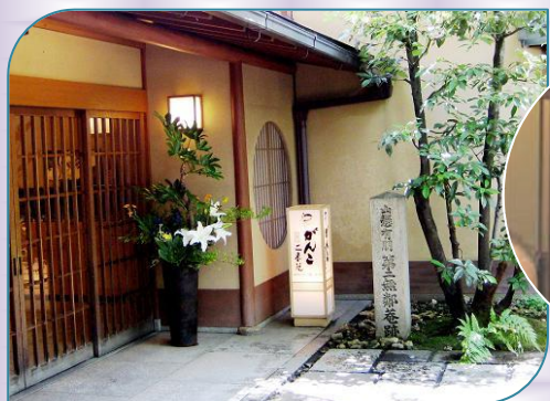
▲がんこの玄関(山縣有朋邸跡の石柱)