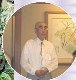
▲小林先生のスピーチ